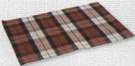
Tovaglietta americana in colone e set guanto, presina e grembiule con fantasia coordinata in stile scozzese. Di Villa D'Este Home .