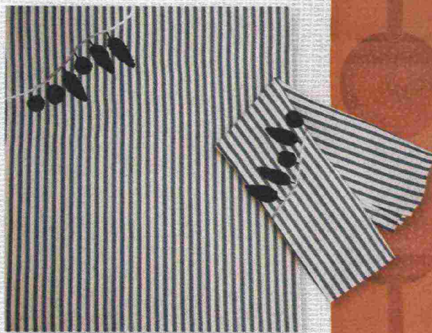
Originale e raffinato il canovaccio "Melograno", con ricamo fatto a mano. Di Busatti , tessitori in Toscana dal 1842.