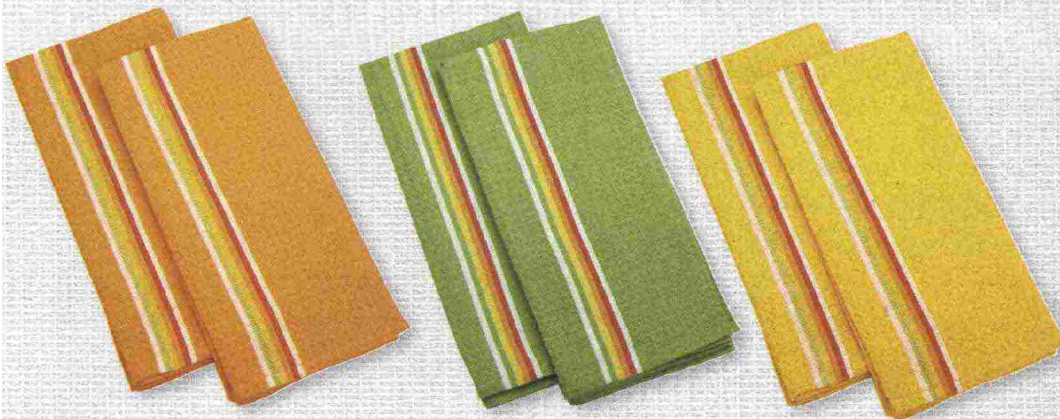
Strofinacci da cucina in resistente fibra di cotone in tante allegre varianti colore. Di Tescoma .