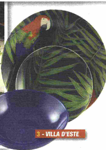
3 - VILLA D'ESTE

html), storica casa di arredi per la tavola, di cui segnaliamo la linea in porcellana dai delicati fiori acquerellati Mariefleur, estremamente primaverile. A 99 euro si può avere un set Basic, con due piatti piani, due piatti da dessert, due scodelle e due bicchieri con manico (Foto 4). È in ceramica, invece, il servizio colorato di Tognana ( https://shop.tognana.com/it/ ), Art and Pepper, ma della stessa azienda segnaliamo anche la linea Lola, sempre in ceramica, con particolari giochi di colore a ricamo tra il grigio e il rosso (Foto 5). Piatti bianchi con grandi fiori rossi e orlature d'oro per Bitossi Home ( www.bitossihome.it/it ) che insieme a Funky Table (giovanе realtà