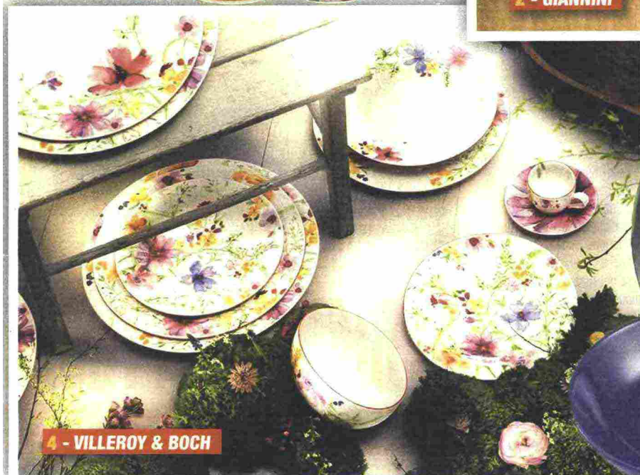
4 - VILLEROY &amp; BOCH