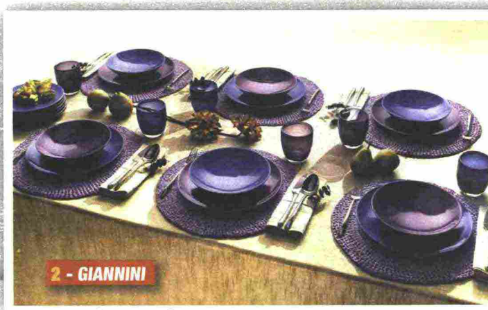
2 - GIANNINI